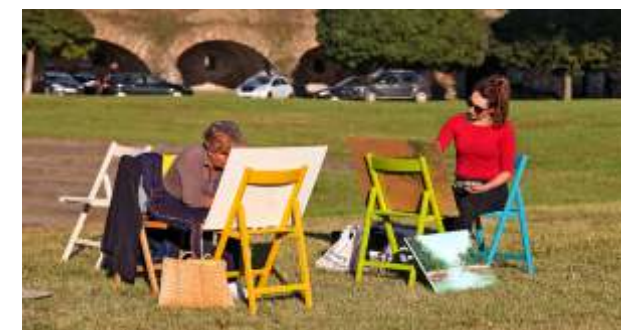
Slikarska kolonija Inspirirani Dravom (Muzej likovnih umjetnosti Osijek)