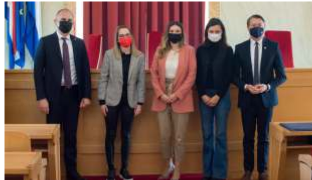
Župan Ivan Anušić s dobitnicima Zelene povelje OBŽ

„Zelenu povelju Osječko-baranjske županije“, javno priznanje za doprinos očuvanju okoliša te osiguravanju i poboljšavanju kakvoće življenja za dobrobit sadašnjih i budućih naraštaja na području Osječko-baranjske županije, danas (26. travnja 2021. godine) župan Ivan Anušić svečano je uručio ovogodišnjim dobitnicima, i to: