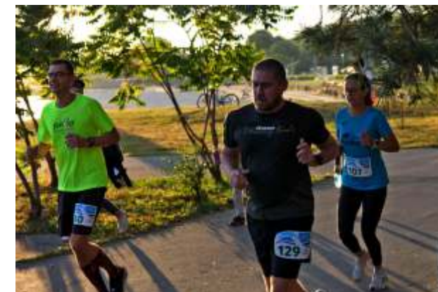
Trkači na 5000 m